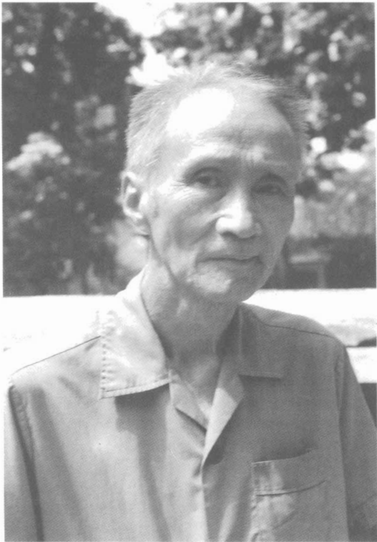
Nguyễn Khắc Viện (1913 - 1997)